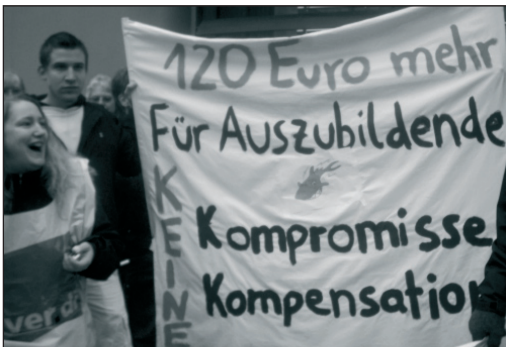
Warnstreik der Azubis des Klinikums im März. Ihre Forderung: 120 Euro mehr im Monat.

Der organisierte Schülerprotest für bessere Bedingungen in der Schule und der gemein-