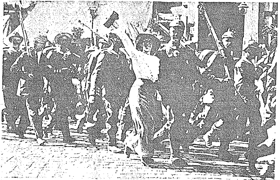
Alles verändert sich: Patriotische Kriegsbegeisterung 1914 — und nur 4 Jahre später deutsche Revolution mit Arbeiter- und Soldatenräten

Weise, zum Beispiel, betrachten Käufer und Verkäufer ein Pfund Zucker. Ebenso betrachten wir die Temperatur der Sonne. Bis vor kurzem betrachteten wir die Kaufkraft des Dollars in gleicher Weise. Aber quantitative Veränderungen über bestimmte Grenzen hinaus verwandeln sich in qualitative. Ein Pfund Zucker, das dem Einfluß von Wasser oder Kerosin 4 ausgesetzt ist, hört auf, ein Pfund Zucker zu sein. Ein Dollar in der Hand eines Präsidenten hört auf, ein Dollar zu sein. Im richtigen Augenblick den kritischen Punkt zu bestimmen, wo Quantität in Qualität umschlägt, ist eine der wichtigsten und schwierigsten Auf-