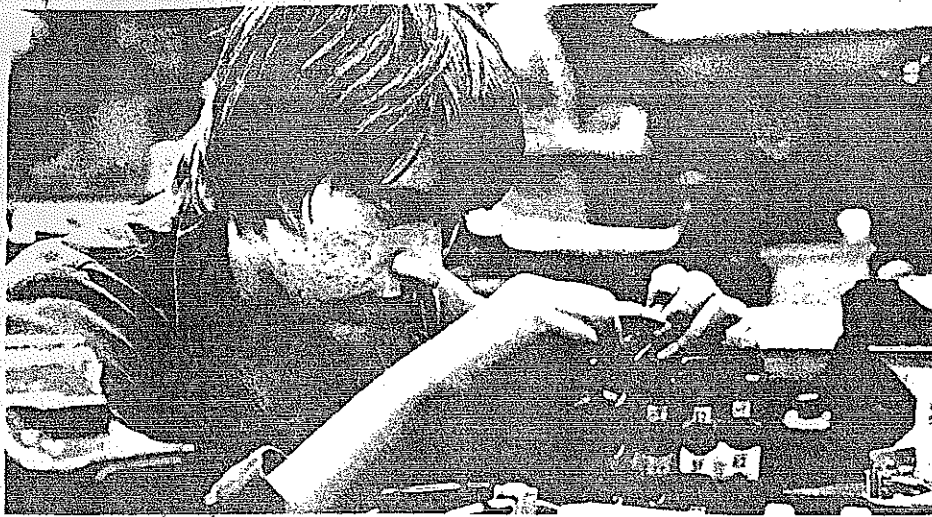
Dialektik im Arbeiteralltag

Dialektisches Denken steht zum üblichen Denken im gleichen Verhältnis wie der Film zur bewegungslosen Fotografie. Der Film macht nicht die bewegungslose Fotografie wertlos, sondern verbindet eine Reihe von ihnen gemäß den Gesetzen der Bewegung. Dialektik verneint nicht den Syllogismus, sondern lehrt uns, Syllogismen derartig zu verbinden, daß wir unser Verstehen der ewig sich verändernden Wirklichkeit näher bringen. Hegel stellte in seiner Logik eine Reihe von Gesetzen auf: Umschlagen von Quantität in Qualität, Entwicklung durch Widersprüche, Widerstreit von Inhalt und Form, Unterbrechung der Kontinuität, Umschlagen von Möglichkeit in Unvermeidlichkeit usw., die ebenso wichtig für das theoretische Denken sind wie einfache Syllogismen für einfache Aufgaben.