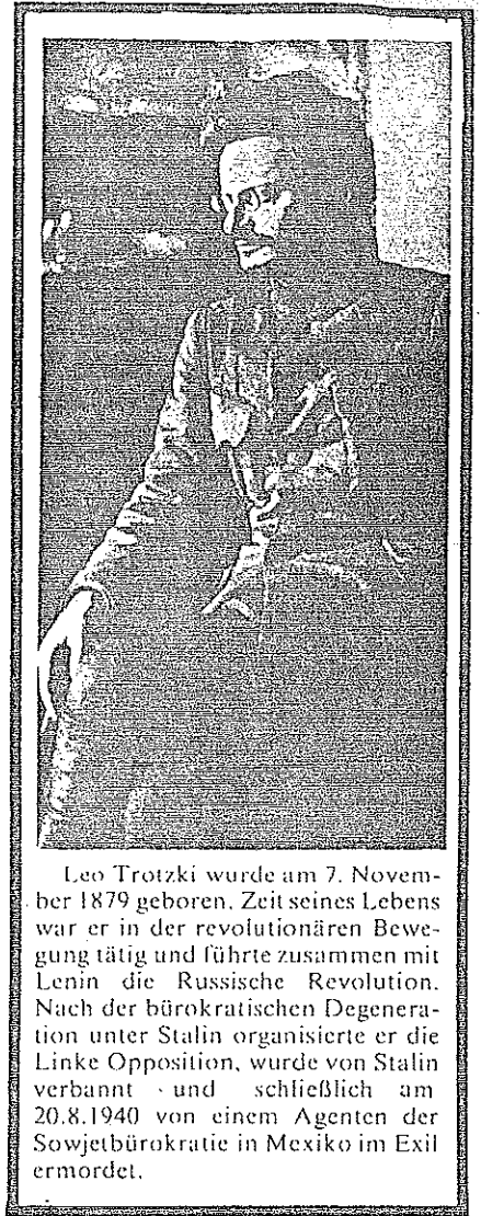
Leo Trotzki wurde am 7. November 1879 geboren. Zeit seines Lebens war er in der revolutionären Bewegung tätig und führte zusammen mit Lenin die Russische Revolution. Nach der bürokratischen Degeneration unter Stalin organisierte er die Linke Opposition, wurde von Stalin verbannt und schließlich am 20.8.1940 von einem Agenten der Sowjetbürokratie in Mexiko im Exil ermordet.

Der grundlegende Fehler des üblichen Denkens liegt darin, daß es sich mit bewegungslosen Eindrücken der Wirklichkeit zufrieden gibt, die aus ewiger Bewegung besteht. Durch weitere Annäherungen, Berichtigungen, Konkretisierungen gibt das dialektische Denken Vorstellungen einen reicheren Inhalt und größere Anpassungsfähigkeit; ich würde sogar sagen, eine Saftigkeit, die sie gewissermaßen den lebenden Erscheinungen nahe bringt. Nicht Kapitalismus im allgemeinen, sondern ein bestimmter Kapitalismus auf einer bestimmten Entwicklungsstufe. Nicht Arbeiterstaat im allgemeinen, sondern ein bestimmter Arbeiterstaat in einem rückständigen Land, eingekreist von Imperialisten, usw.