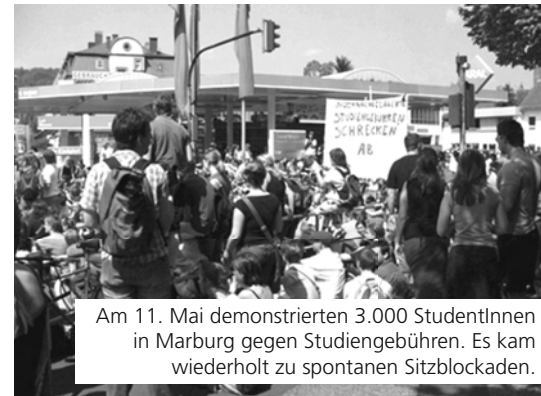
Am 11. Mai demonstrierten 3.000 StudentInnen in Marburg gegen Studiengebühren. Es kam wiederholt zu spontanen Sitzblockaden.

Außerdem ist eine Mobilisierung zur bundesweiten Demo am 3. Juni in Berlin zum gemeinsamen Protest mit Beschäftigten, Erwerbslosen und RentnerInnen nötig. Damit können Gewerkschaften in die Pflicht genommen werden weitergehende Proteste und Streiks zu organisieren. So eine Bewegung hätte die Macht auch Studiengebühren zu kippen.