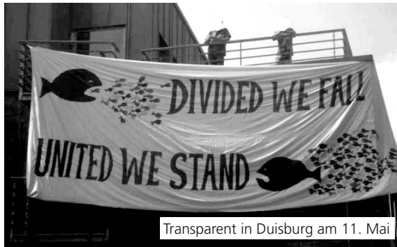
Transparent in Duisburg am 11. Mai

Werde mit uns aktiv, komm auf unsere Treffen und unterstütze uns in unseren Kampagnen.