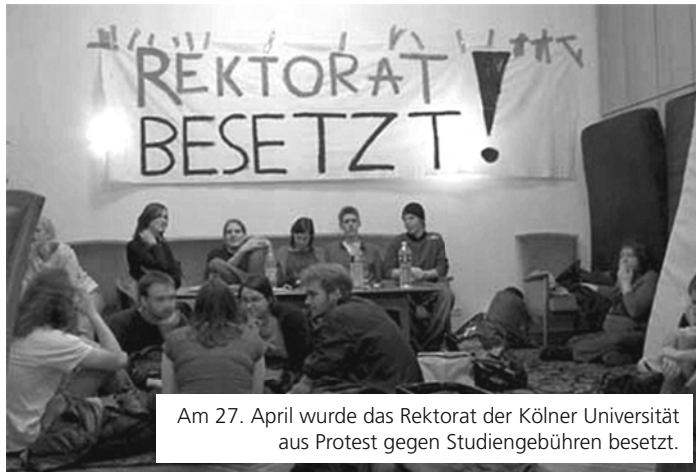
Am 27. April wurde das Rektorat der Kölner Universität aus Protest gegen Studiengebühren besetzt.

Auch in Deutschland stehen Angriffe auf große Teile der Bevölkerung auf der Tagesordnung: Mit Studiengebühren wird Bildung zum Privileg für Reiche. Das ist ein Beispiel dafür, dass das gesamte Bildungssystem Schritt für Schritt nach den Profitinteressen von Konzernen ausgerichtet wird. Im Klartext heißt das: Elitebildung für wenige und Bildung auf Sparflamme für den Rest.