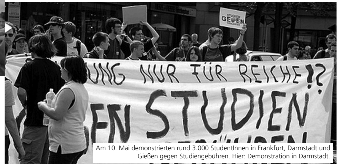
Am 10. Mai demonstrierten rund 3.000 StudentInnen in Frankfurt, Darmstadt und Gießen gegen Studiengebühren. Hier: Demonstration in Darmstadt.

Die Proteste der 68er haben viele Fortschritte für die Studierenden erkämpft. Als sich die Möglichkeit dafür bot, wurden diese zurückgenommen. Das zeigt, dass einzelne Reformen im Kapitalismus nicht auf Dauer gesichert und von den Herrschenden zurückgenommen werden können. Die SAV tritt daher neben dem Kampf für einzelne Verbesserungen für eine sozialistische Gesellschaft ein. Das bedeutet, dass die Wirtschaft und alle gesellschaftlichen Bereiche, wie z.B. Bildung nach den Bedürfnissen der Mehrheit der Menschen demokratisch geplant werden.