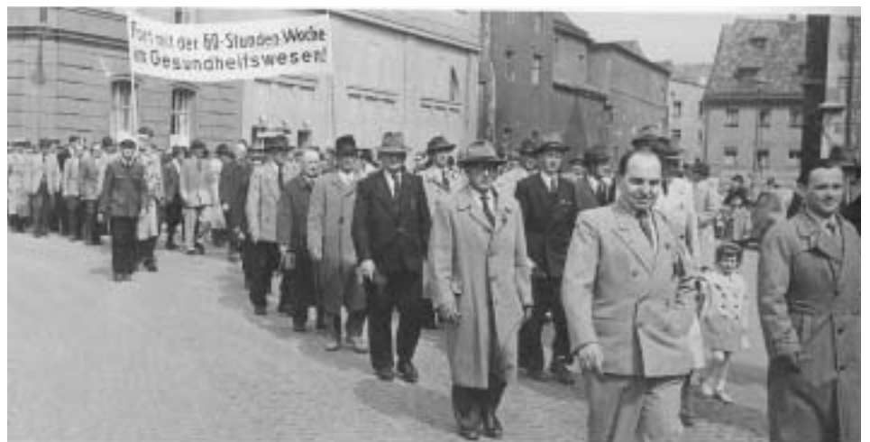
Die »guten alten Zeiten« im »goldenen Westen«. Demonstration gegen die 60-Stunden im Gesundheitswesen

Wir rufen dazu auf, die Linkspartei.PDS zu wählen. Die Unterschiede müssen zurück stehen, um für eine starke Opposition im Bundestag zu sorgen.